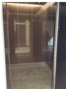
事務所用ローカルエレベーターかご内