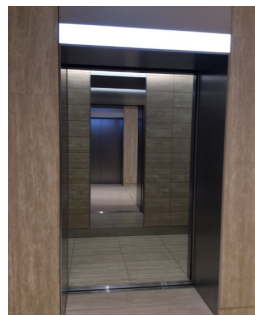
事務所用シャトルエレベーターかご内