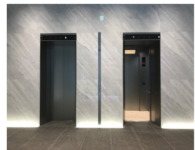
商業用エレベーター乗場