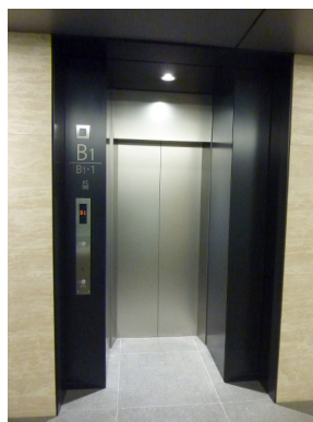
サービス用エレベーター乗場