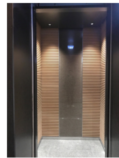
事務所用VIPエレベーターかご内