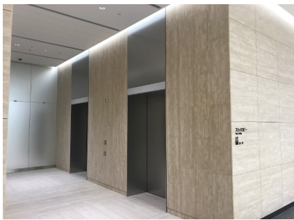
事務所用シャトルエレベーター乗場