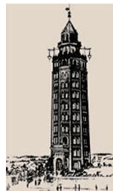
凌雲閣（りょううんかく）

1890年（明治23年）11月10日、東京、浅草に完成した12階建ての展望塔「凌雲閣」に、日本初の電動式エレベーターが設置されました。日本エレベーター協会では、この11月10日を「エレベーターの日」と定め、昇降機の安全、安心な利用のためのキャンペーンを実施しています。