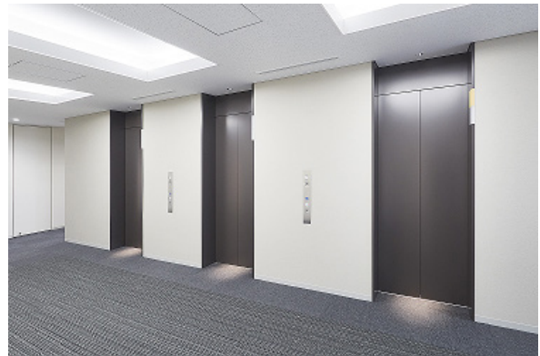
乗用エレベーター 乗場