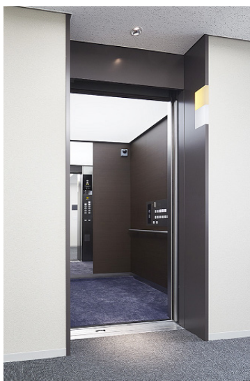
乗用エレベーター 乗場