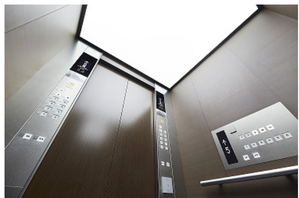
乗用エレベーター かご内