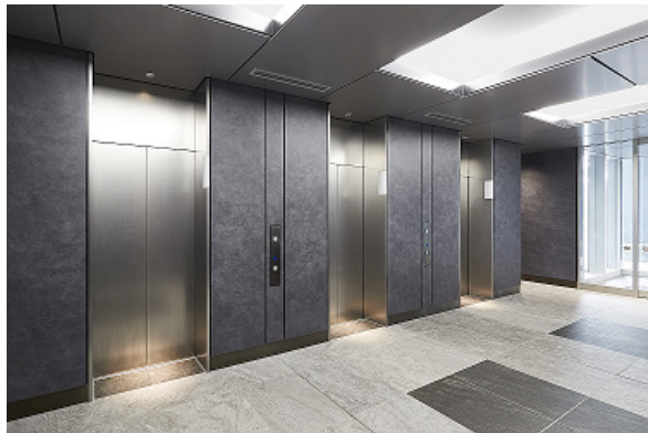
乗用エレベーター 乗場