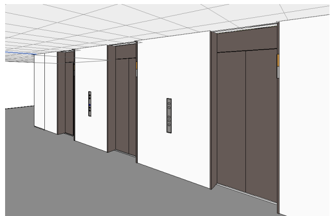
乗用エレベーター BIMモデル 乗場