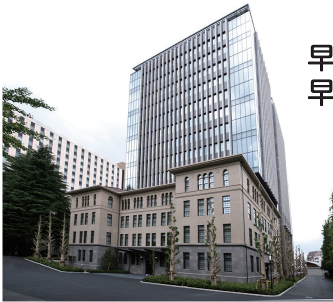
建 物 外 観