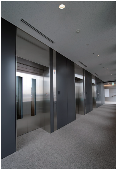
エレベーター乗場