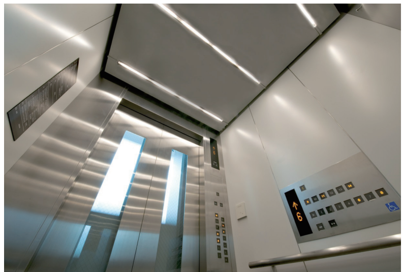
エレベーターかご内