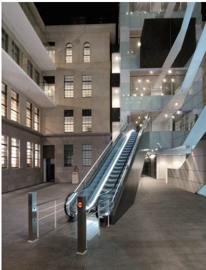
エントランスホール エスカレーター