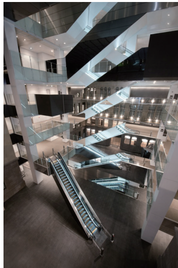
再現棟内エスカレーター