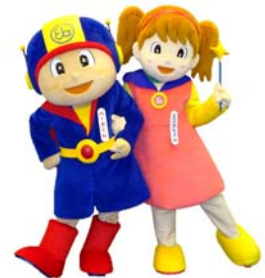
ベータくん エスカちゃん