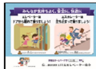
ポスターデザインの ポケットティッシュ