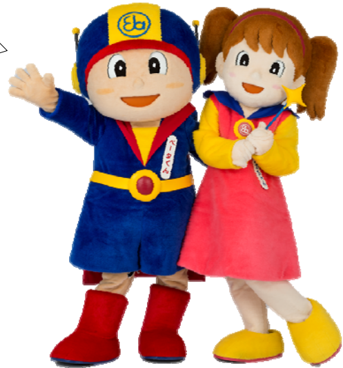
ベータくん エスカちゃん

エレベーター、エスカレーターは便利な縦の交通手段であり、健常な方も、障がいがある方も、高齢の方も、子ども達も、全ての方が安全に、安心してご利用いただくため、当協会ではこの「エレベーターの日」を機会に、安全な利用方法についてお知らせする活動を毎年行っています。