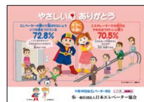
ポスターデザインのポケットティッシュ