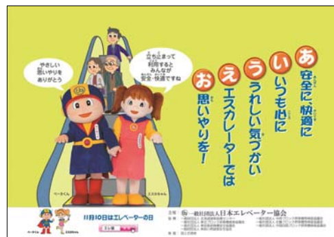
エスカレーター ポスター