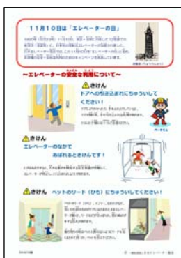
エレベーター・エスカレーターの安全利用リーフレット