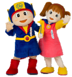
ベータくん エスカちゃん

8割以上が「エスカレーターの歩行はやめたほうがいい」 エレベーター・エスカレーター利用者アンケート結果より