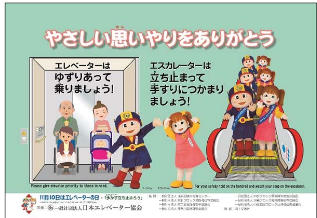
全国統一ポスター、ステッカーのデザイン

なお、ポスターは当協会ホームページからダウンロードでき、幅広く安全利用にご活用いただけます。