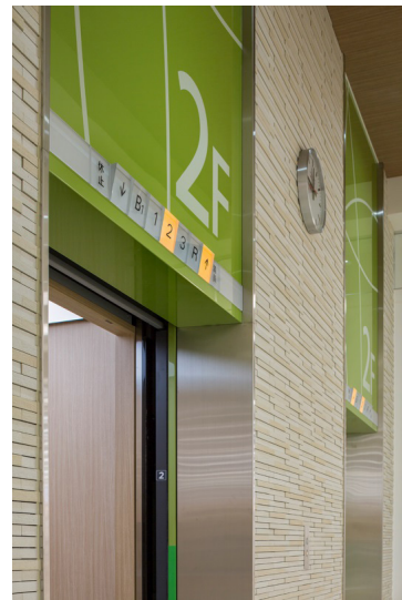
乗用エレベーター乗場 2階