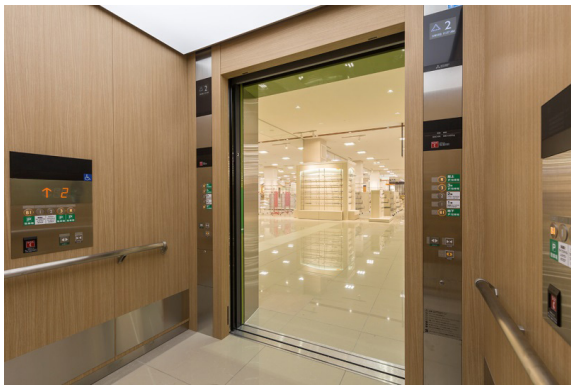
乗用エレベーター かご内