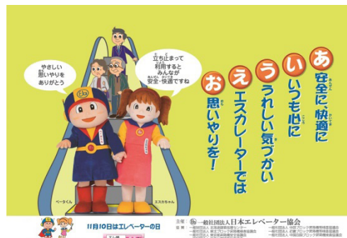
エスカレーター ポスター