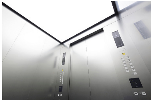
オフィス用エレベーター かご内