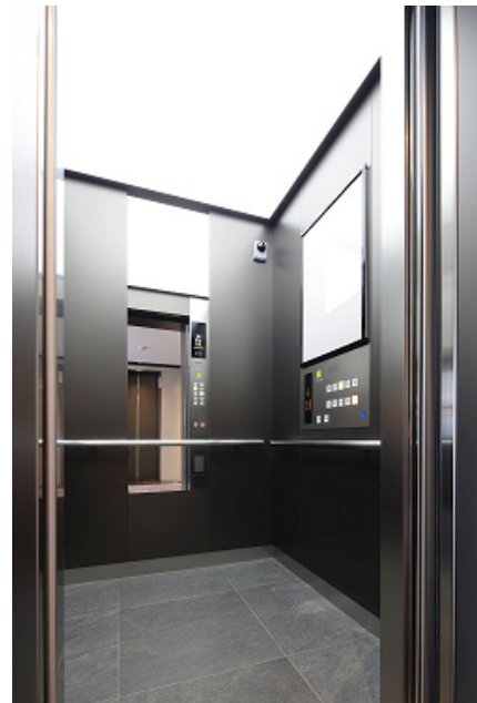
ホテル用エレベーター かご内