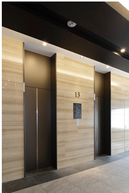
ホテル用エレベーター 13階乗場