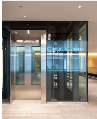
ミュージアム乗用 2階乗場