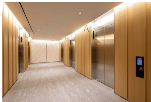
オフィス乗用 2階乗場