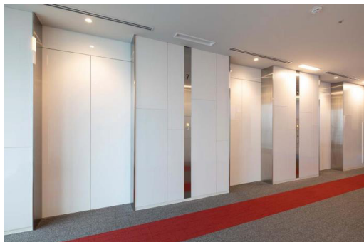
オフィス乗用 7階乗場