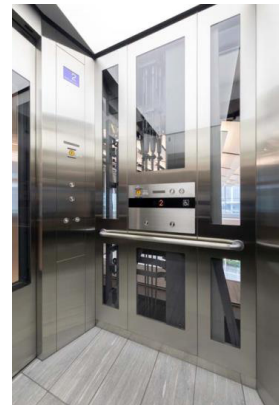
ミュージアム乗用 かご内