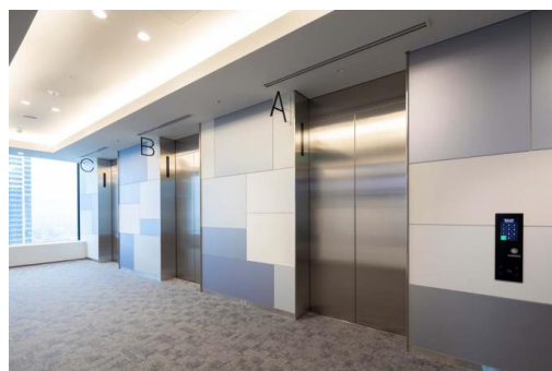
オフィス乗用 17階乗場