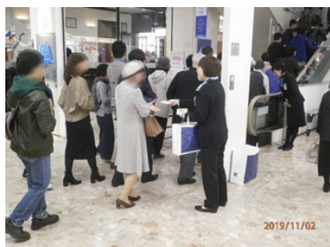
川徳 パルクアベニュー川徳店