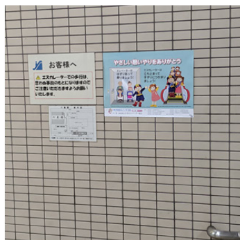
東京都交通局 千石駅