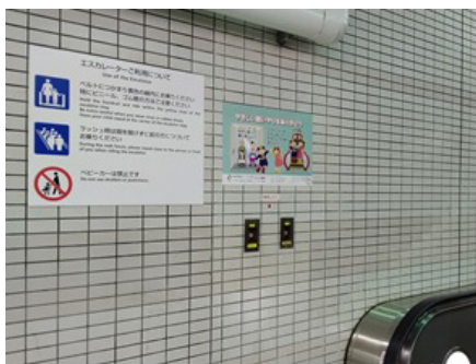
東京地下鉄 荻窪駅