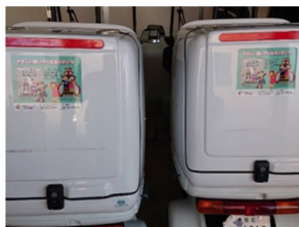
サービスバイクにステッカーを貼付