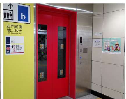
東京地下鉄 四谷三丁目駅