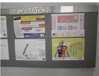
川徳 パルクアベニューカワトク店

3. 新聞広告の掲載（掲載日：11月10日）神奈川県支所：毎日新聞神奈川版に広告を掲載しました。