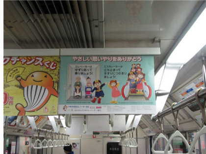
札幌市交通局 市営地下鉄