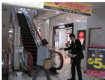
さくら野百貨店 八戸店