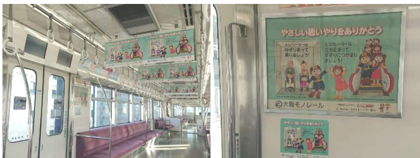
大阪高速鉄道 大阪モノレール