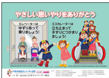
全国統一ポスター