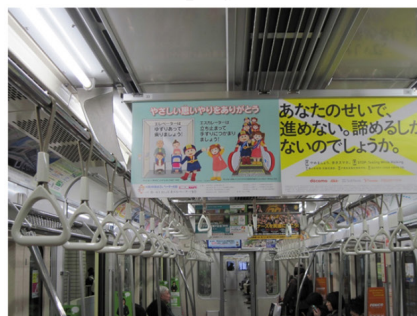
仙台市交通局 地下鉄南北線