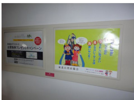
さくら野百貨店 北上店