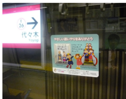
東京都交通局 大江戸線