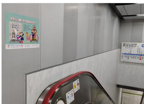
東京都交通局 神保町駅