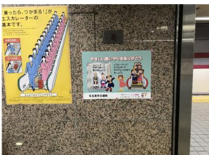
名古屋市交通局 久屋大通駅