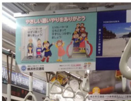
横浜市交通局 電車内中吊り