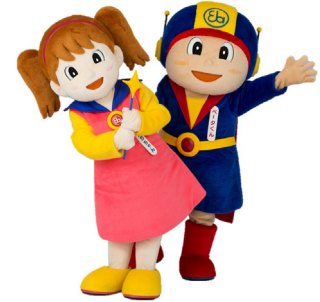
11月11日 名古屋市交通局 久屋大通駅(名古屋市交通局、東海支部)