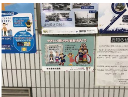
名古屋市交通局 名古屋駅