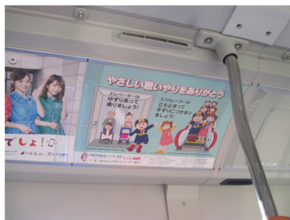
仙台市交通局 市営バス