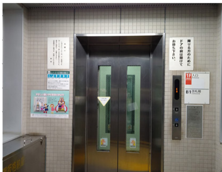
東京都交通局 水道橋駅