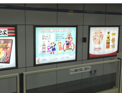
福岡市交通局 福岡空港駅 電照看板