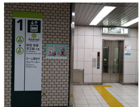
東京都交通局 曙橋駅