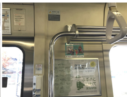
東日本旅客鉄道 盛岡～一関