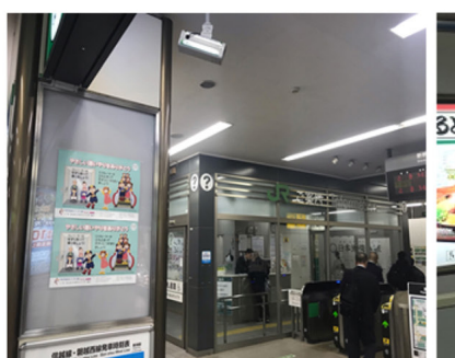
東日本旅客鉄道 新潟駅