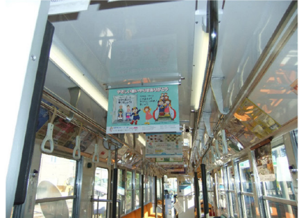
函館市企業局交通部 市電