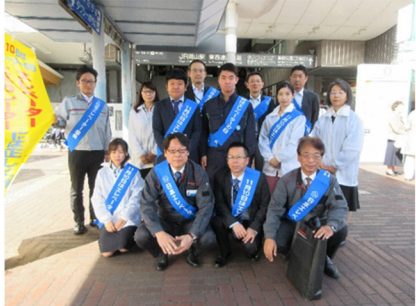
11月8日西日本旅客鉄道岡山駅 東口駅前広場 (中国・四国支部)