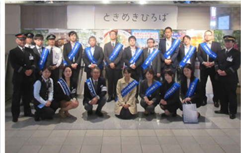
11月7日 福岡市交通局 天神駅改札付近 (福岡市交通局、ちかまるくん、九州支部)