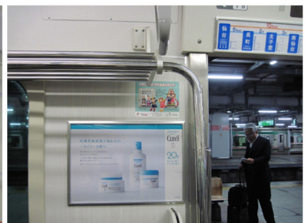
仙台空港鉄道 仙台空港アクセス線