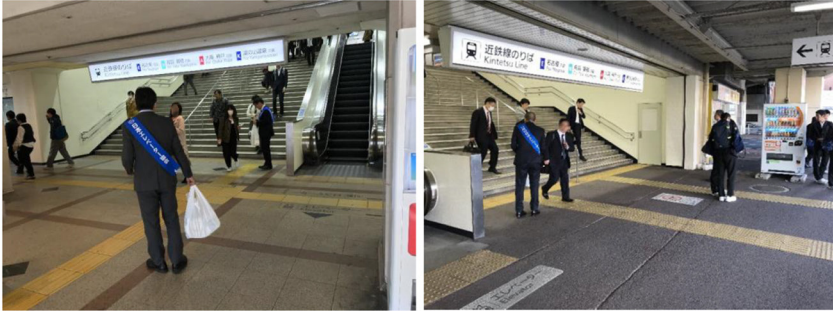
11月8日 近畿日本鉄道 四日市駅(東海支部)