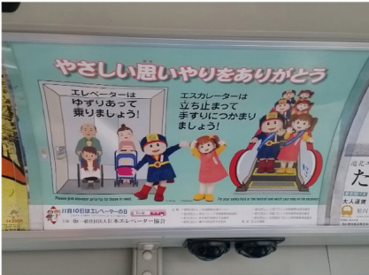
旭川市電気軌道 バス