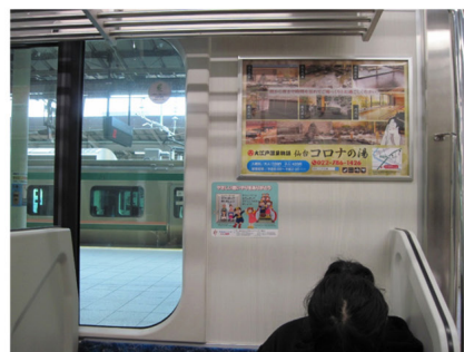
東日本旅客鉄道 仙山線