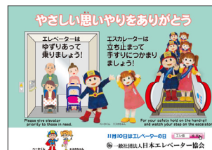
ポスターデザインのポケットティッシュ