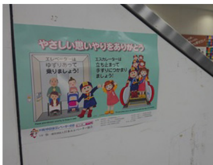
西武池袋線 富士見台駅