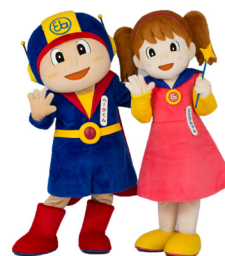
ベータくん エスカちゃん

11月10日 「エレベーターの日」 やさしい思いやりを ありがとう キャンペーン実施報告 2019年度