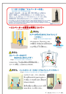
エレベーター、エスカレーターの安全利用リーフレット

「エレベーターの日」に次の表1に示す場所で、エレベーター、エスカレーターの安全利用リーフレット、全国統一ポスターをデザインしたポケットティッシュ及び蛍光ペン（以下「キャンペーン品」という。）又は、ポケットティッシュを全国10ヶ所にある支部、支所関係者又は鉄道事業者各社局のご協力を得て49,637個配布し、エレベーター、エスカレーターの安全な利用について呼びかけました。