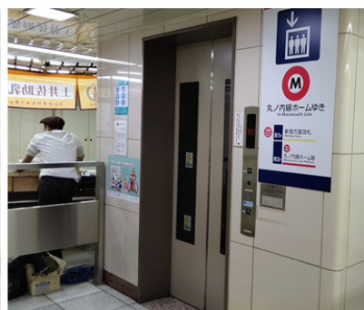
東京地下鉄 新宿三丁目駅