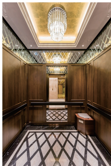
リニューアル後 かが内背面