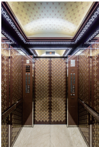
リニューアル前 かが内正面