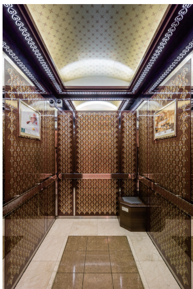
リニューアル前 かが内背面