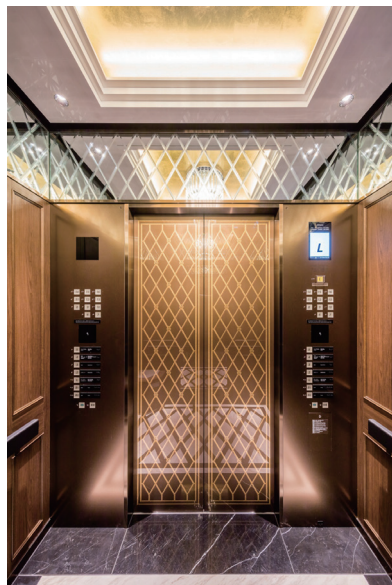
リニューアル後 かが内正面