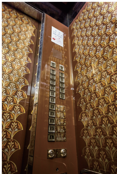
リニューアル前 かが内操作盤