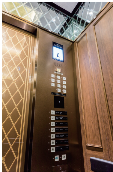
リニューアル後 かが内操作盤