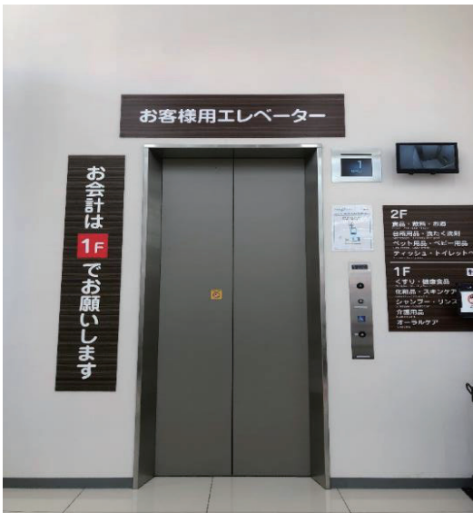
乗用エレベーター 1階乗場