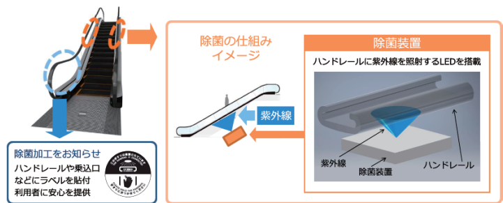
エスカレーター【ハンドレール除菌装置】採用