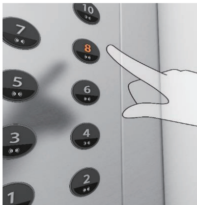
かご内操作盤【非接触ボタン】採用