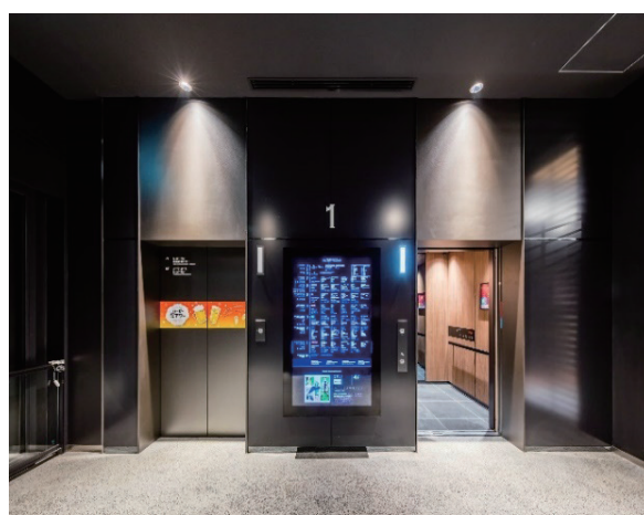
ELV7、8号機 1階エレベーターホール