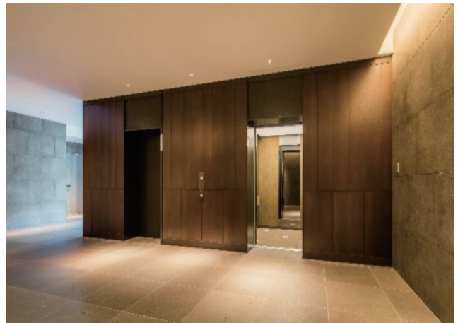
ELV21、22号機 9階ホテルロビー