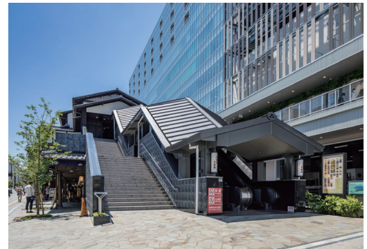
城下町エスカレーター