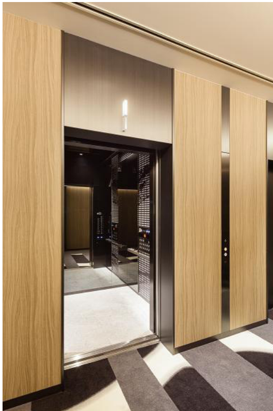
エレベーターホール2