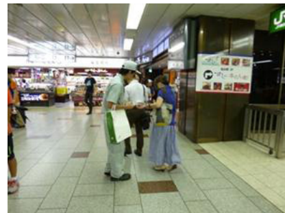
駅構内での安全活動