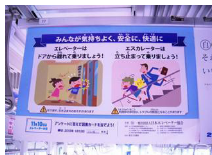
安全利用の周知ポスター車内吊り