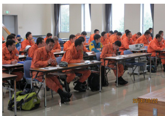
「神奈川県消防学校」エレベーター 教育訓練状況（2014年10月22日）