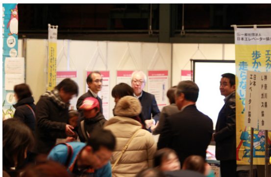
出初式会場入口とブースの状況