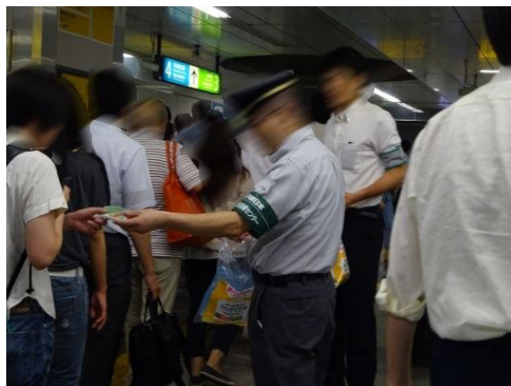
ポケットティッシュ配布風景