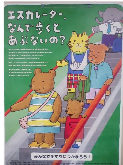
安全キャンペーンポスター

当支部においては、本部と連携して、東日本旅客鉄道（JR東日本）殿が計画したポケット