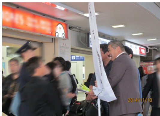
「エレベーターの日」横浜駅西口街頭 キャンペーン（2014年11月10日）