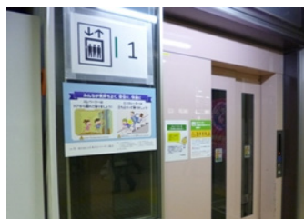
掲出中のポスター

東北地区の消防関係者へのエレベーター閉じ込め救出訓練に関しては、消防学校に設置されているエレベーターを活用し、2014年は消防隊員298人、これまでの2年間で、計589人に参加いただきました。