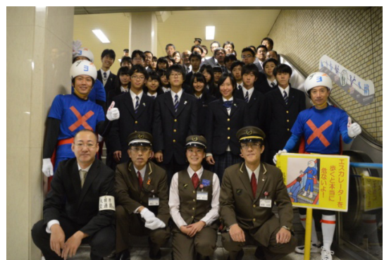
大通り駅構内での活動