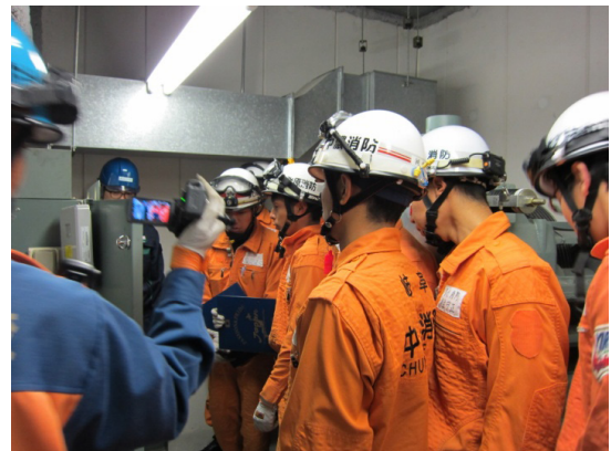
エレベーター閉じ込め救出訓練風景 (岐阜県消防学校：2014年12月3日)

消防訓練、名古屋市交通局との安全周知活動及び「エレベーターの日」の活動を紹介します。