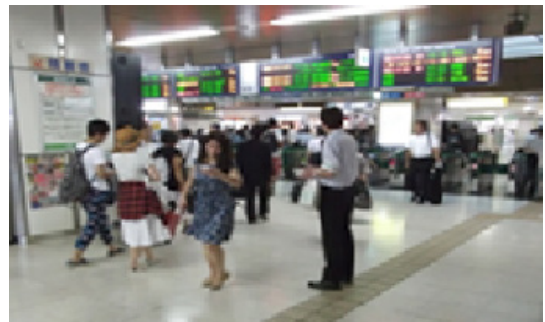
札幌駅構内での活動