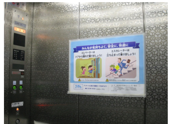
「安全周知ポスター掲出」 (名古屋市交通局：2014年11月から2015年1月まで)