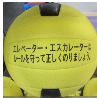
「エレベーターの日」 小学校へ寄贈した ドッジボール (2014年11月7日)