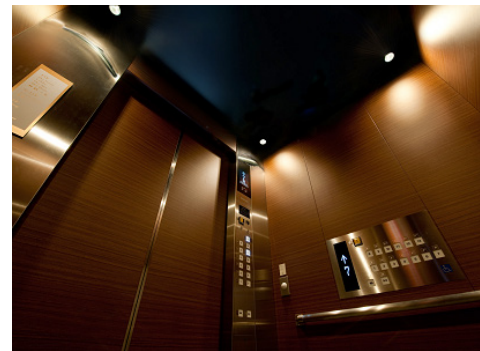
ホテル用エレベーターかご内