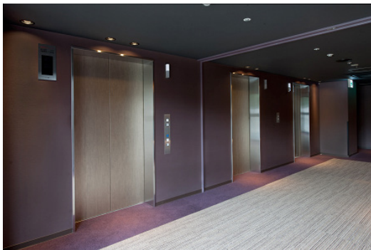
ホテル一般階エレベーターホール