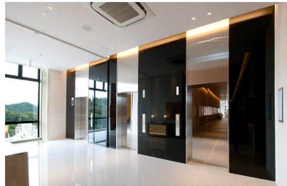
13階ホテルロビー階エレベーターホール