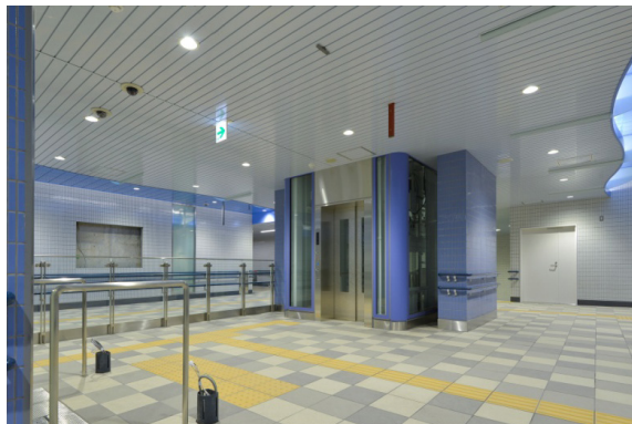
八木山動物公園駅

エスカレーターは上下双方向に配置し、ホームと地上とを楽に行き来できるよう配慮しています。閑散時には自動的に停止する自動運転装置を採用し、省エネルギーに配慮するほか、荷物や歩行による瞬間的な衝撃で安全装置が動作してしまうことを防止する誤動作防止機能を採用し、利用者の安全も確保しています。