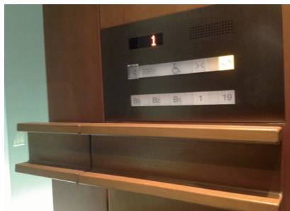
住宅シャトル用エレベーターかご内