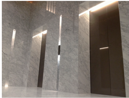
事務所ローカル用エレベーター 1階ホール