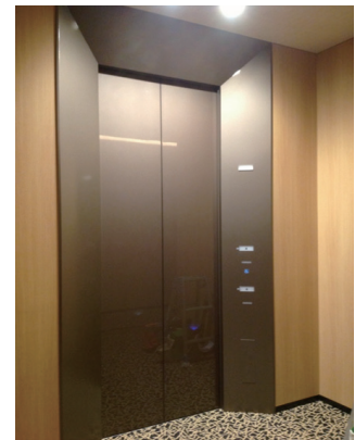
住宅シャトル用エレベーターホール