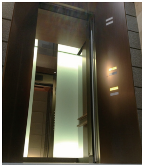
住宅シャトル用エレベーターかご内