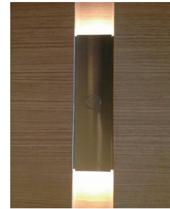
事務所ローカル用エレベーター 一般階ホールボタン