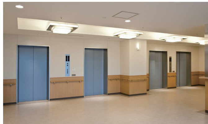
乗用（2・3号機）、寝台用（4・5号機）基準階乗場