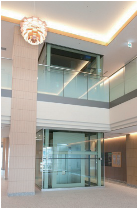
展望用（1号機）乗場（背面）