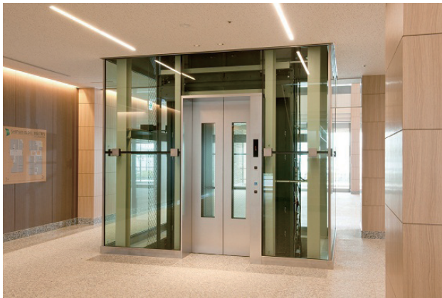
展望用（1号機）1階乗場