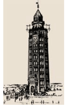
凌雲閣（りょううんかく）

On November 10, 1890, the first electric elevator in Japan had been installed to the "Ryoun un kaku", a 12-story observation tower in Asakusa, Tokyo. The Japan Elevator Association has set this November 10 as an "the elevators day" anniversary and is conducting a campaign to promote safe and secure use of elevators and escalators.