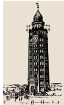
凌雲閣（りょううんかく）

On November 10, 1890, the first electric elevator in Japan had been installed to the "Ryoun un kaku", a 12-story observation tower in Asakusa, Tokyo. The Japan Elevator Association has set this November 10 as an "the elevators day" anniversary and is conducting a campaign to promote safe and secure use of elevators and escalators.