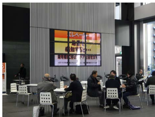
会場内大型モニターにて安全利用アニメーションを放映した。