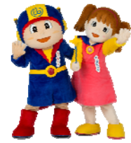
ベータくん エスカちゃん

約9割が「エスカレーターの歩行はやめたほうがいい」 エレベーター・エスカレーター利用者アンケート結果より