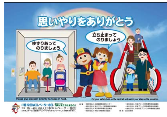
全国統一ポスター、ステッカーのデザイン