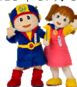
ベータくん エスカちゃん

アンケートでエスカレーターを歩行してしまうと答えた人の割合は82%から61%へ5年連続で減少