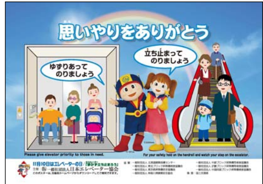
全国統一ポスター、ステッカーのデザイン